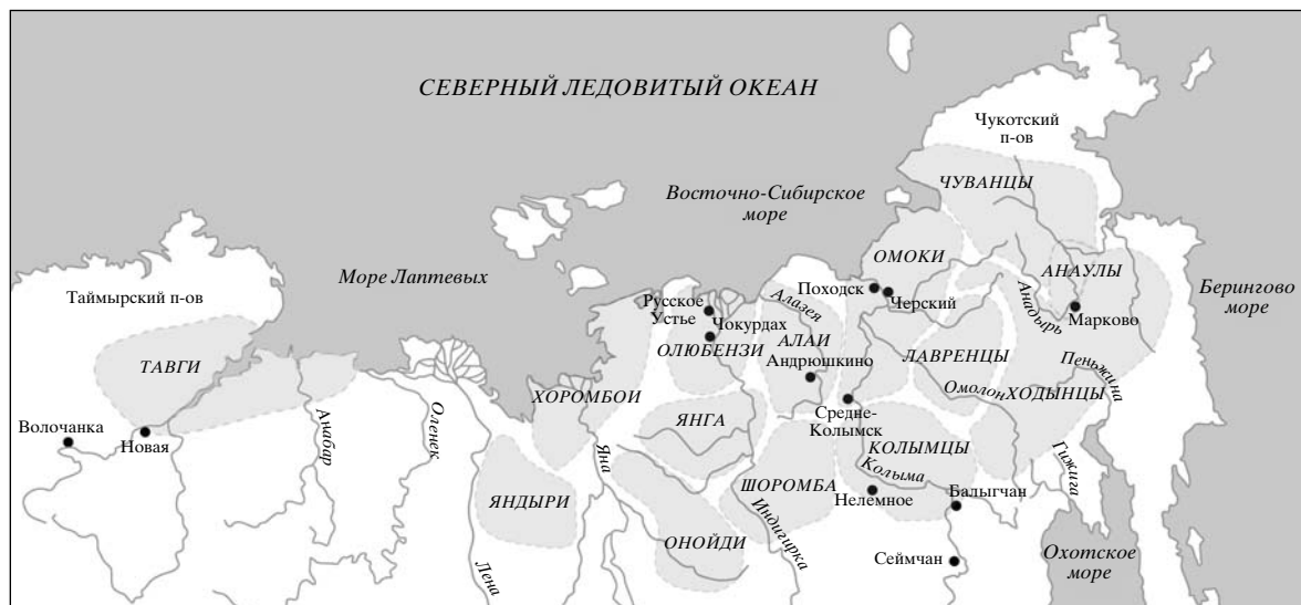
Рис. 1. Традиционная территория обитания юкагирских племен в XVII в. [4]. Черными кружочками обозначены современные поселки, в которых проводили экспедиционные сборы проб крови для анализа мтДНК (дополнительная информация приведена в [9]).

ских земель к Русскому государству численность юкагиров стала сокращаться, прежде всего из-за опустошительных эпидемий оспы и кори. К началу XX столетия от юкагирского этнического пласта остались лишь несколько территориальных групп – в междуречье Яны и Нижней Индигирки, на Алазее, Нижней и Верхней Колыме. Их общая численность, включая юкагиров-чуванцев Анадыря, не превышала одной тысячи человек [5–7]. По месту своего обитания юкагиры подразделялись на тундровых охотников на дикого северного оленя и таежных охотников на лося. К настоящему времени юкагиры почти полностью смеша-